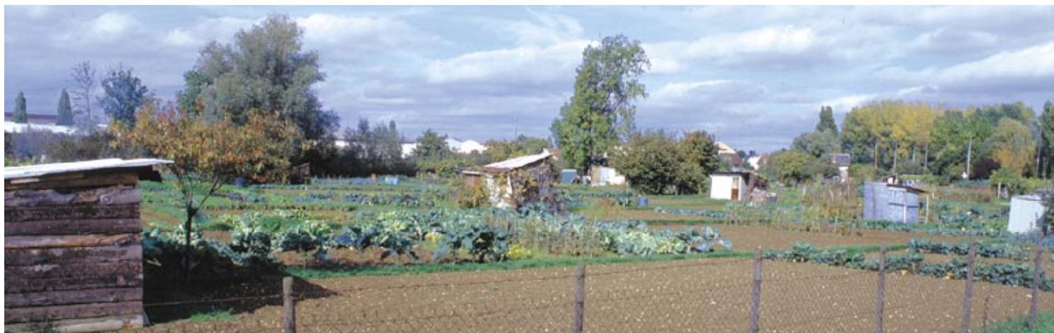
Jardins ouvriers du Moulon

Cet ensemble qui comprend 90 logements et 4 boutiques, se présente sous la forme d'un îlot rectangulaire intégrant des jardins et des squares. La "cité-jardin" du Moulon, construite juste après la loi