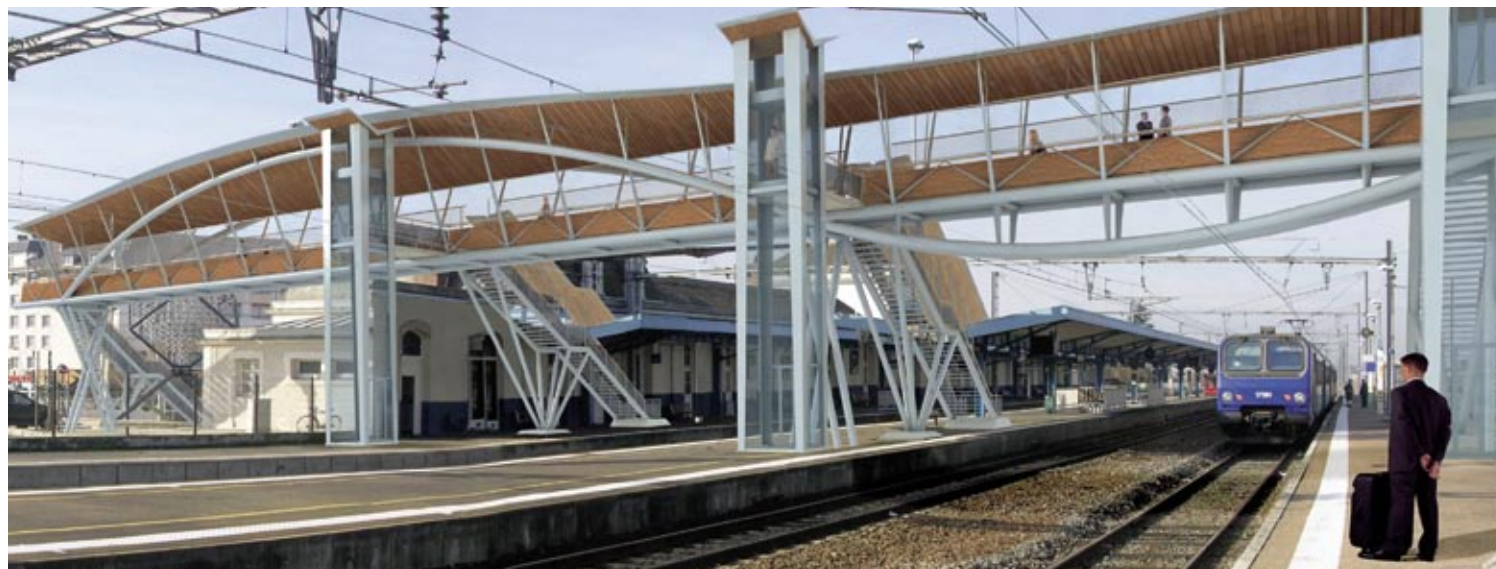
Vue 3D du projet depuis les quais

Un bâtiment d'accueil de la SNCF sera également créé dans cet espace. Ce local couvert, accessible aux heures d'ouverture de la gare, regroupera notamment une billetterie automatique pour les trains des lignes régionales et grandes lignes, un affichage d'information pour les voyageurs. Des sanitaires publics seront également aménagés ainsi qu'un espace dédié à la location de voitures.