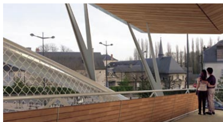
Vue depuis la passerelle côté gare

Elle permettra également une liaison directe entre le Nord de Bourges et le centre-ville. Ce chantier devrait s'achever en décembre 2009.