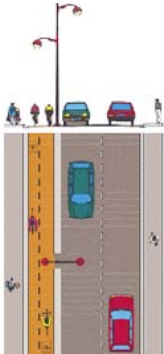
Projet de renouvellement urbain Rue F.Chédin

un parking de 32 places sera aménagé rue Félix Chédin, à l'angle de la rue Ampère ; d'autre part des places de stationnement seront aménagées dans la partie nord de la rue plus large, ainsi que rue de la sente aux Loups.