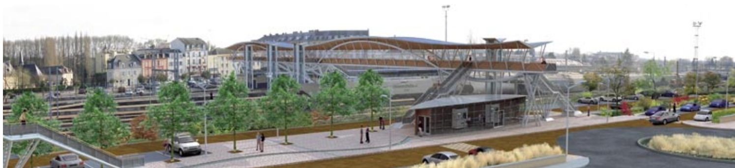
Vue 3D du projet depuis la passerelle réutilisée côté rue Félix Chédin