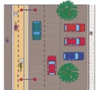
Projet de renouvellement urbain Rue de la Sente aux Loups