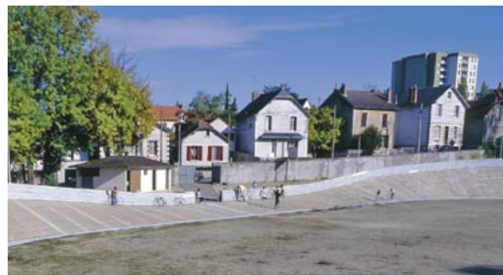
Vélodrome de Tivoli

réunissait les membres de cette "institution" : le Maire et son Conseil municipal, les pompiers, le garde champêtre... La "commune libre" du Moulon a connu un grand succès jusque dans les années cinquante. En 1946 et 1947, elle a reçu son homologue de Montmartre.