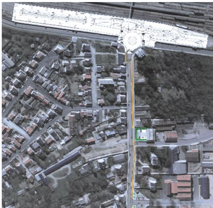
Rue Felix Chédin - Tronçon sud