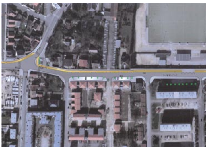
Rue de la Sente aux Loups - Tronçon ouest

Le stationnement sur les trottoirs sera interdit à terme. En effet, d'une part