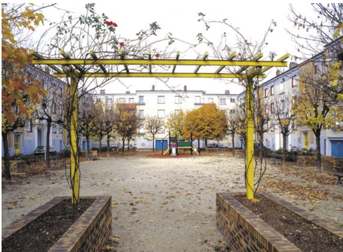
Cité-jardin "Louis Loucheur"